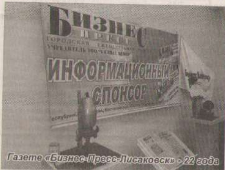
Газете «Бизнес-Пресс-Лисаковск» - 22 года