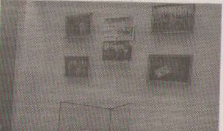
Газета «Позитив-Лисаковск» трижды была подарком для лисаковцев